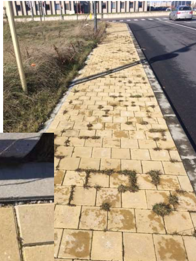
Ch. d'Haecht – 1an après les travaux